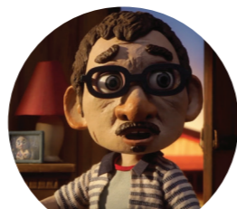
Le père de Kéria

Je suis un petit orang-outan. J'ai perdu ma maman et je suis recueilli par une famille d'humains.